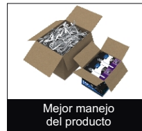
Mejor manejo del producto

Paquetes individuales de 20 o 100 cubiertos en lugar de sueltos en la caja, reducción de costos en el transporte y la distribución.