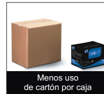
Menos uso de cartón por caja