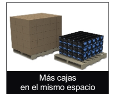
Más cajas en el mismo espacio